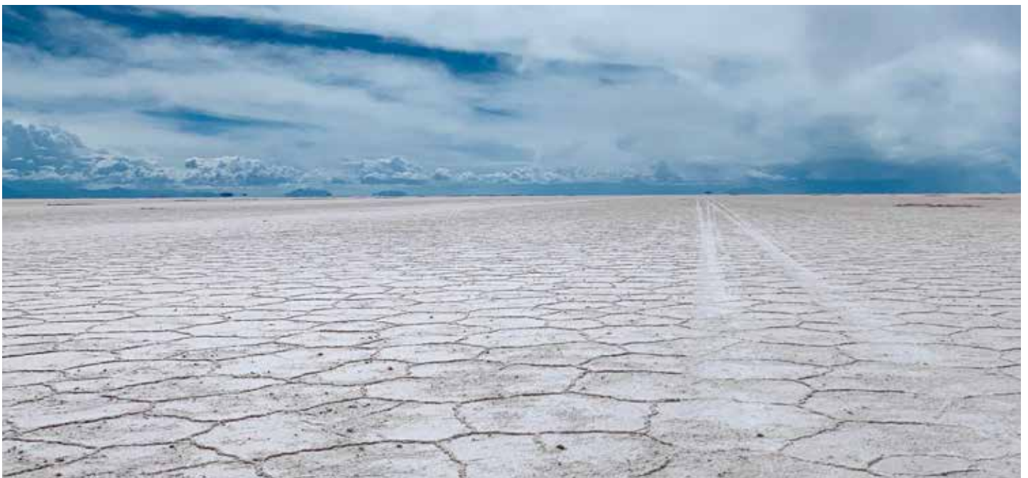
Salar de Uyuni

Es war eine Zeit, die ich nie vergessen werde und für die ich sehr dankbar bin!