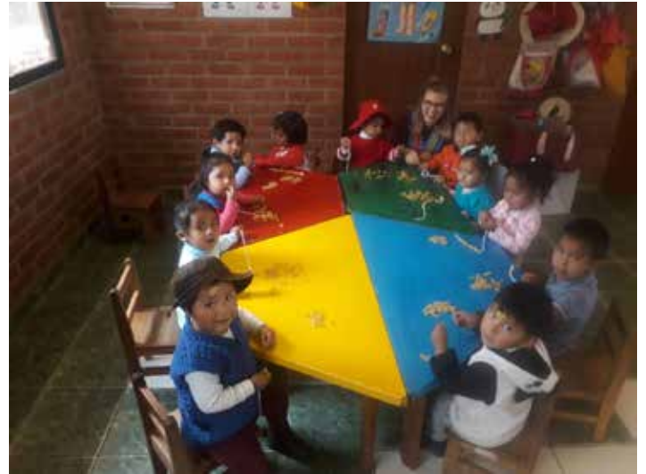
Meine Arbeit im Kindergarten

Kindheit ausleben können und mit viel Liebe respektiert und behandelt werden.