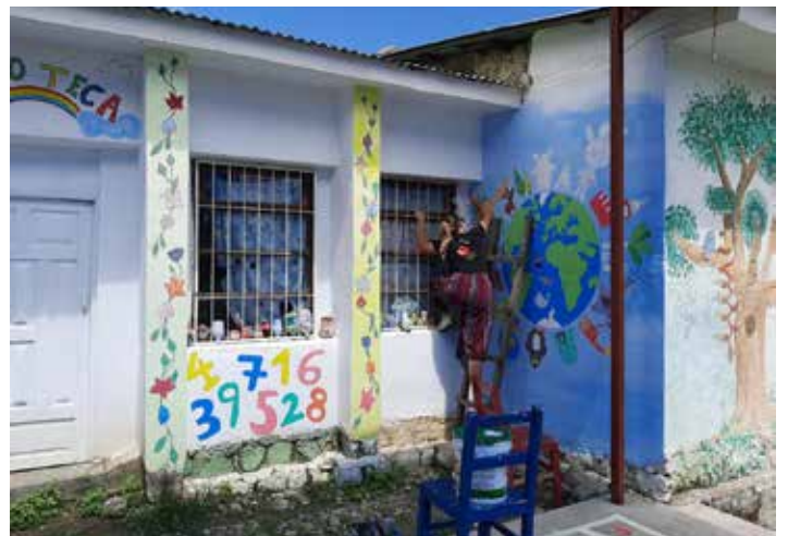
Wandmalerei als Verschönerung der Fassade