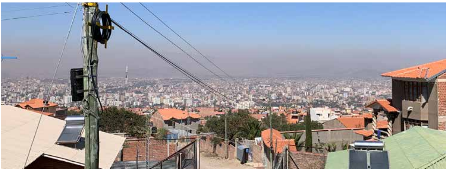
Blick von Tirani auf Cochabamba

In Tirani, einem kleinen Dorf oberhalb von Cochabamba, wo sich auch das Projekt befindet, wohnte ich mit 2 andern Freiwilligen zusammen und dort arbeiteten wir auch zusammen. Wir wurden nach einer gewissen Zeit Teil dieser Dorfgemeinschaft, da jeder die Freiwilligen kennt, auch wenn wir längst nicht alle kannten. Uns war bald bewusst, dass in manchen Familien Gewalt herrscht, wir wussten Bescheid über die Alkoholprobleme der Eltern und über das schlechte Bildungs- und Gesundheitssystem. Die Kinder werden öfters vernachlässigt, deshalb ist es umso wichtiger, dass sie im Kindergarten sowie in der Hausaufgabenbetreuung ihre