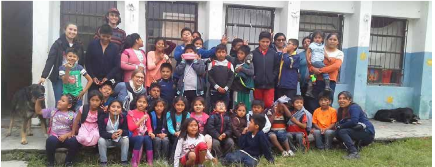
Die Kinder der Hausaufgabenhilfe mit ihren BetreuerInnen

Was haben mich die Leute hierzulande mit großen Augen angeschaut, als sie hörten, dass ich mich nach der „Premiere“ nicht für den „normalen“ Weg Richtung Universität oder Ausbildung, sondern für ein anderes Abenteuer entschied.