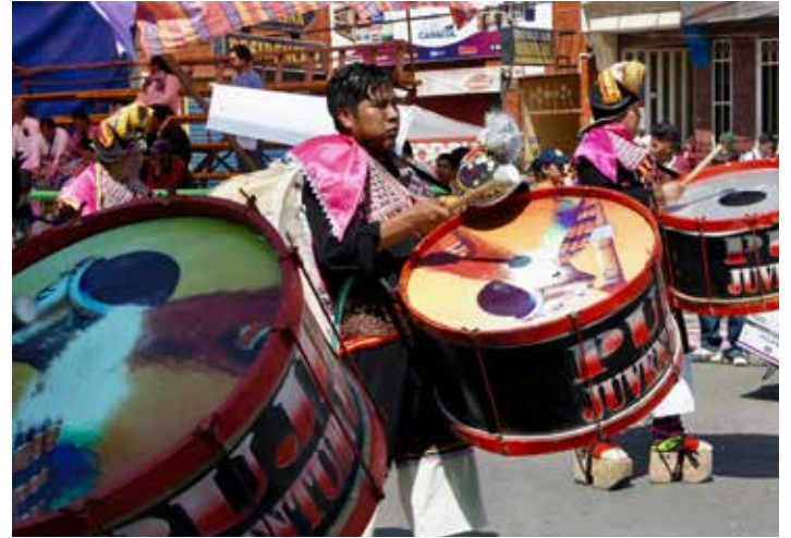
Farbenprächtige Umzüge in Cochabambas Straßen

Aber auch konnte ich während dieser freien Zeit die verschiedensten Landschaften Boliviens entdecken. Im Südwesten von Bolivien entdeckte ich zum Beispiel die größte Salzwüste der Welt - Salar de Uyuni - , im Tiefland von Bolivien, in Rurrenabaque befand ich mich mitten in den großen Regenwäldern, in den Anden bestaunte ich den höchstgelegenen See der Welt - Titicacasee - und in La Paz blieb mir nach paar Schritten auf 3.600 m Höhe die Luft weg. In Bolivien kann man einiges entdecken und die verschiedensten Landschaften sehen.