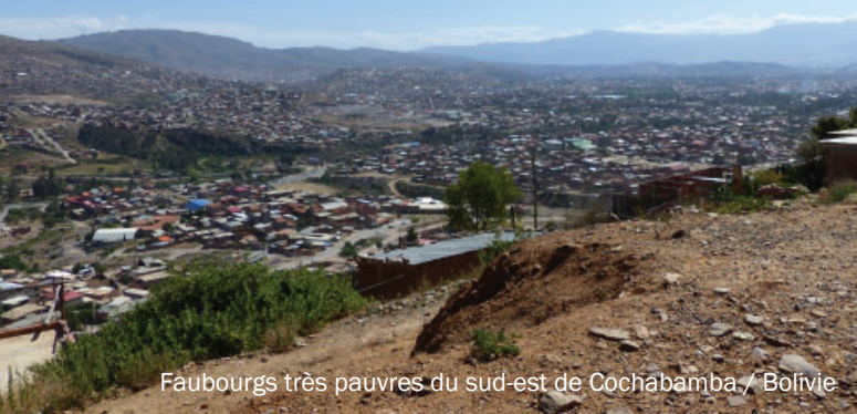
Faubourgs très pauvres du sud-est de Cochabamba / Bolivie

En 2022, Niños de la Tierra a octroyé la somme de 139.232 € de dons à divers petits projets sans demander le cofinancement étatique.