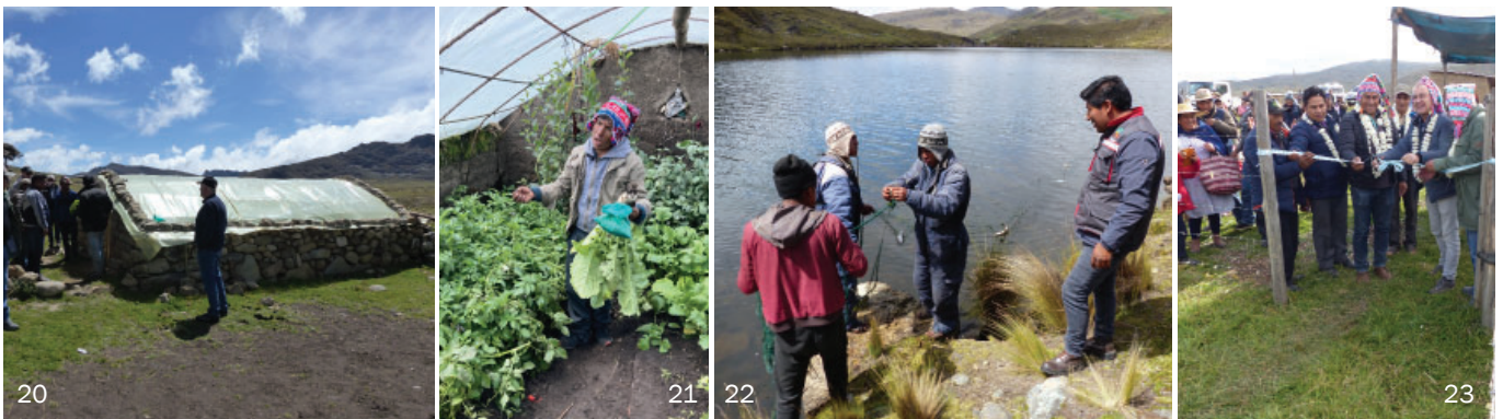
realisierter Projektteile zum Thema Nahrungsmittelsicherheit und integrale Erziehung / siehe INFO 2-2020 oder auf www.niti.lu .