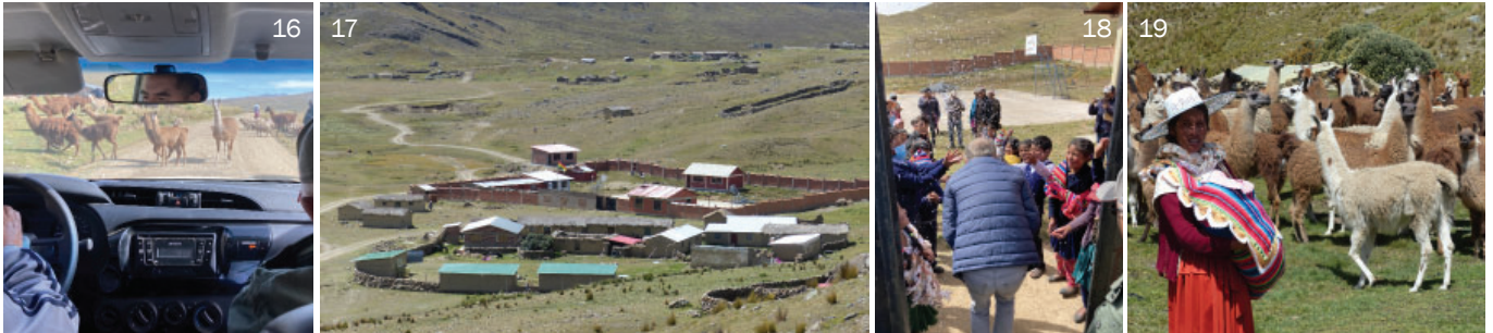
Mit ANAWIN unterwegs im Hochland nach Montecillo/Huaripucara und Umgebung (16-22) und Chapisirca (23-26): Besichtigung