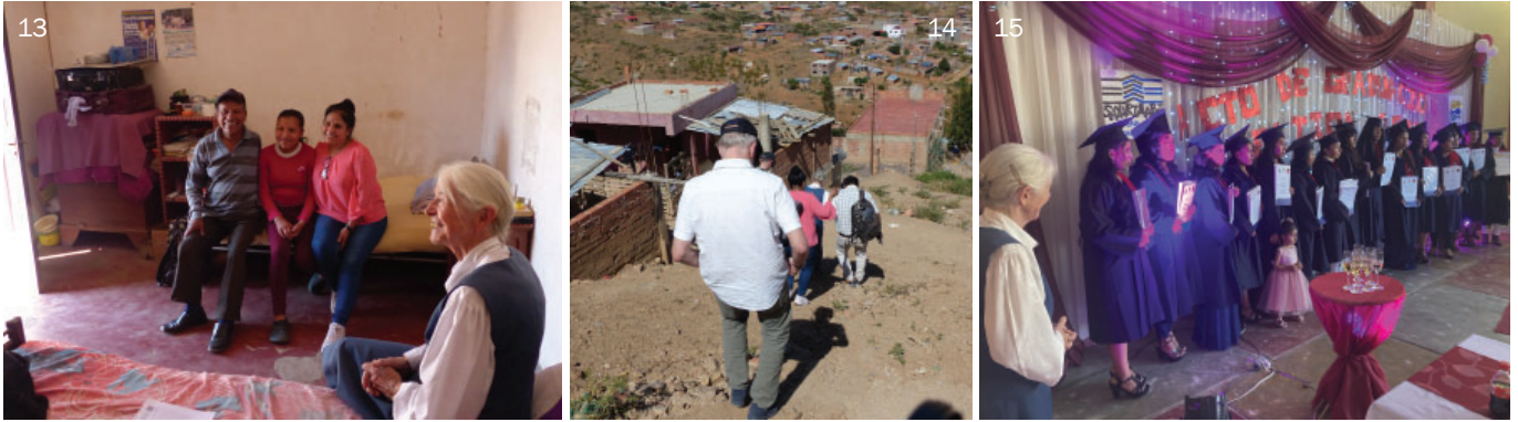
Besuch bedürftiger Familien - Großeltern, welche die Erziehung ihrer Enkelkinder übernommen haben - in von prekären Lebensverhältnissen geprägten Randbezirken von Cochabamba (13-14). Abschlussfeier des Tecnológico Sayarinapay in Tirani (15).