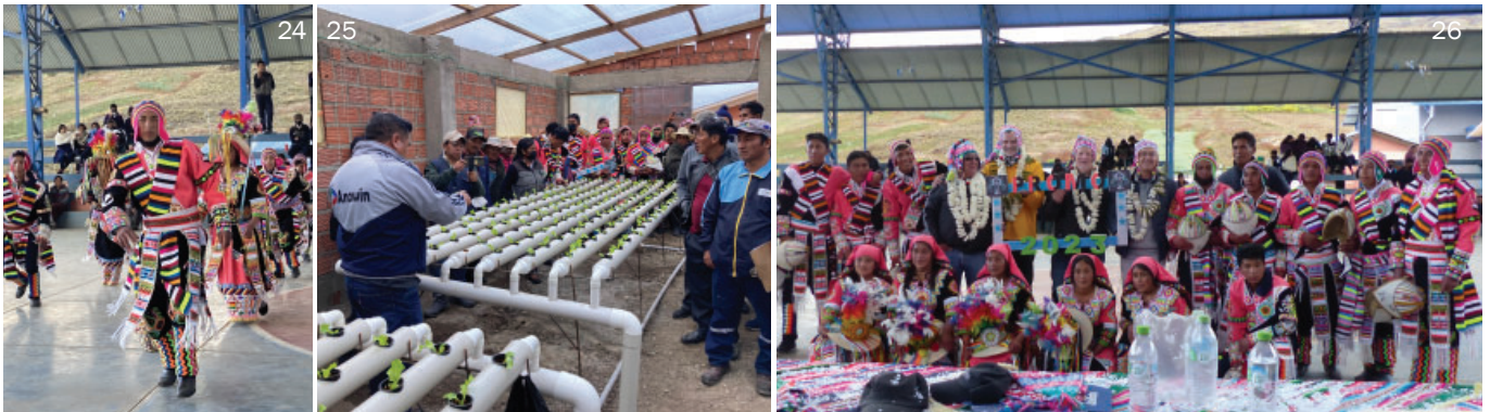
Feierliche Eröffnung der Schulerweiterung „Tupac Katari“ in Tuscapujio/Sacaba und Besichtigung der umliegenden Familien-