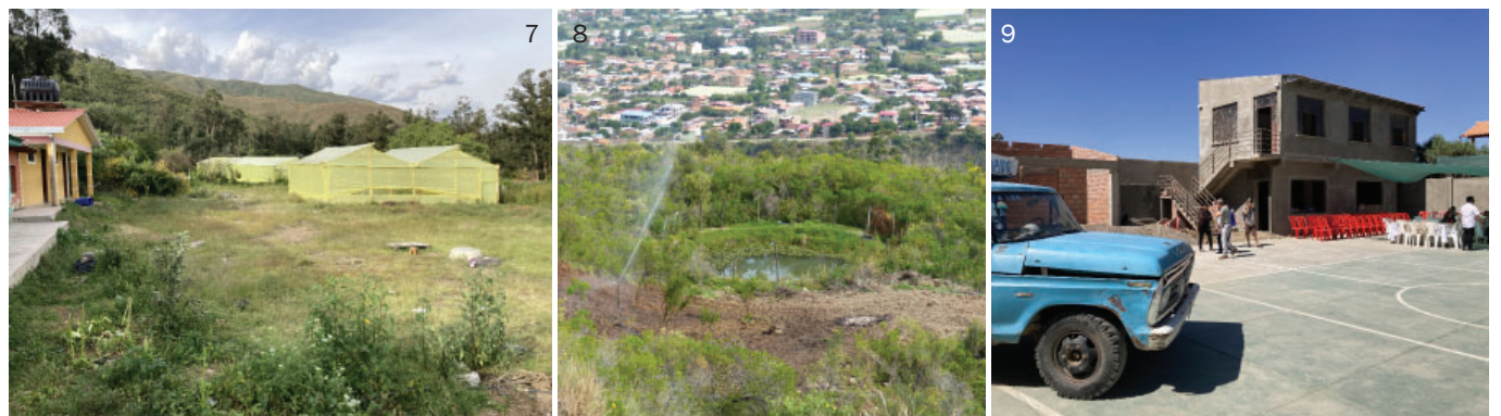
auch die Gemeiden Chokaya (7-8) mit ökologischen Garten- und Landbauprojekten, sowie Tunari (9-11) mit einem Kindergartenneubau / siehe dazu INFO 1-2023 oder auf www.niti.lu . Projekt/Arbeitsbesprechung in den Büros der FCVB (12).