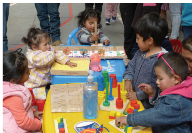
Appui pédagogique par Contexto à Potosí / Bolivie

Un deuxième argument fait référence à la théorie du chaos. Ce qu'affirme la théorie du chaos, c'est qu'une déviation très faible sur un paramètre peut exercer une influence importante sur la situation résultante à une date ultérieure. L'idée serait donc de dire dans notre contexte que même avec un petit