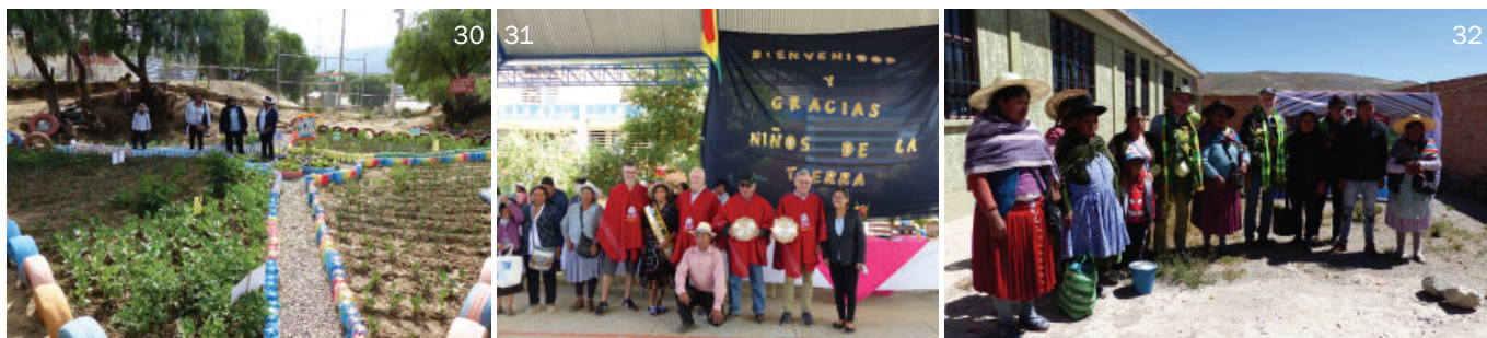
und Schulgärten (27-31) / siehe INFO 3-2022 oder www.niti.lu . Unterwegs mit CONTEXTO in Potosi: Besuchen der Gemeinschaften und Gärten im kofinanzierten Projekt in Karachipampa (32-34) und Samasa Baja (35-36) / siehe INFO 3-2021 oder www.niti.lu .