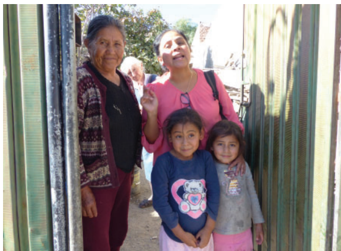
Grand-mère et ses 2 petits enfants à charge à Tirani / Bolivie

En 1972, le météorologue Edward Lorenz fait une conférence à l'American Association for the Advancement of Science intitulée (et traduit en français) : « Prédicibilité : le battement d'ailes d'un papillon au Brésil peut-il provoquer une tornade au Texas ? » Des travaux récents ont montré que la modélisation de l'atmosphère n'est pas affectée par l'effet papillon, car un effet minime est « noyé » et oublié sans incidence perceptible pour la totalité. Il n'en est pas moins vrai que de petits facteurs peuvent avoir d'immenses effets. (Wikipédia) C'est donc une bonne analogie pour se souvenir que de petits changements peuvent parfois entraîner des résultats radicaux à long terme. C'est ce que l'on appelle dans le jargon la "sensibilité aux conditions initiales".