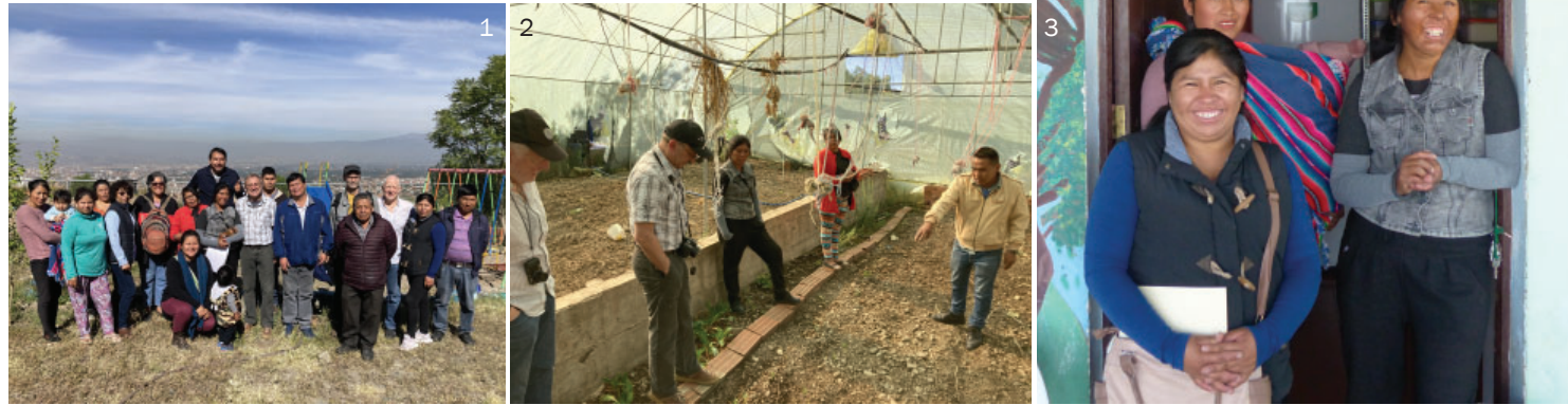
Unterwegs mit der FCVB in den nördlichen Randgemeinden von Cochabamba: Besuch der Kindergärten in Taquiña Chico (1-3) und